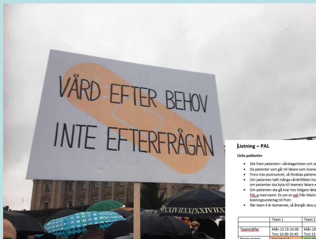
Att vård ska ges efter behov och inte efter resurser eller vem som skriker högst borde vara självklart för alla inom hälso- och sjukvården.